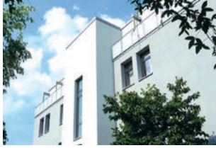
St. Loreto Ellwangen