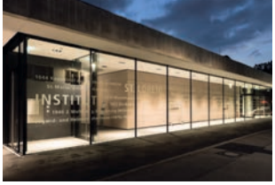
St. Loreto Schwäbisch Gmünd