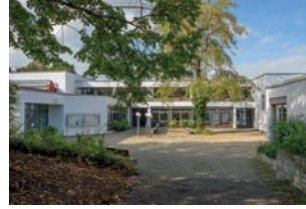
St. Loreto Ludwigsburg