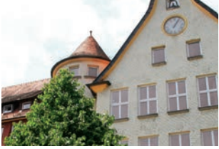
St. Loreto Aalen