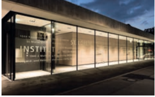
St. Loreto Schwäbisch Gmünd