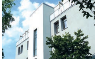
St. Loreto Ellwangen