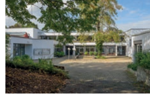
St. Loreto Ludwigsburg