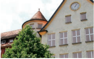
St. Loreto Aalen